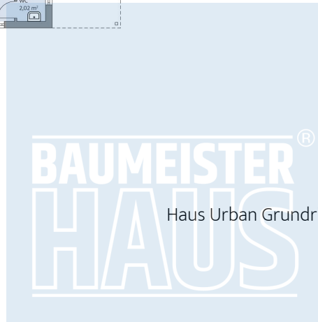
Haus Urban Grundriss