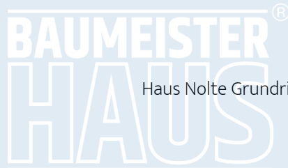
Haus Nolte Grundriss