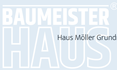
Haus Möller Grundriss