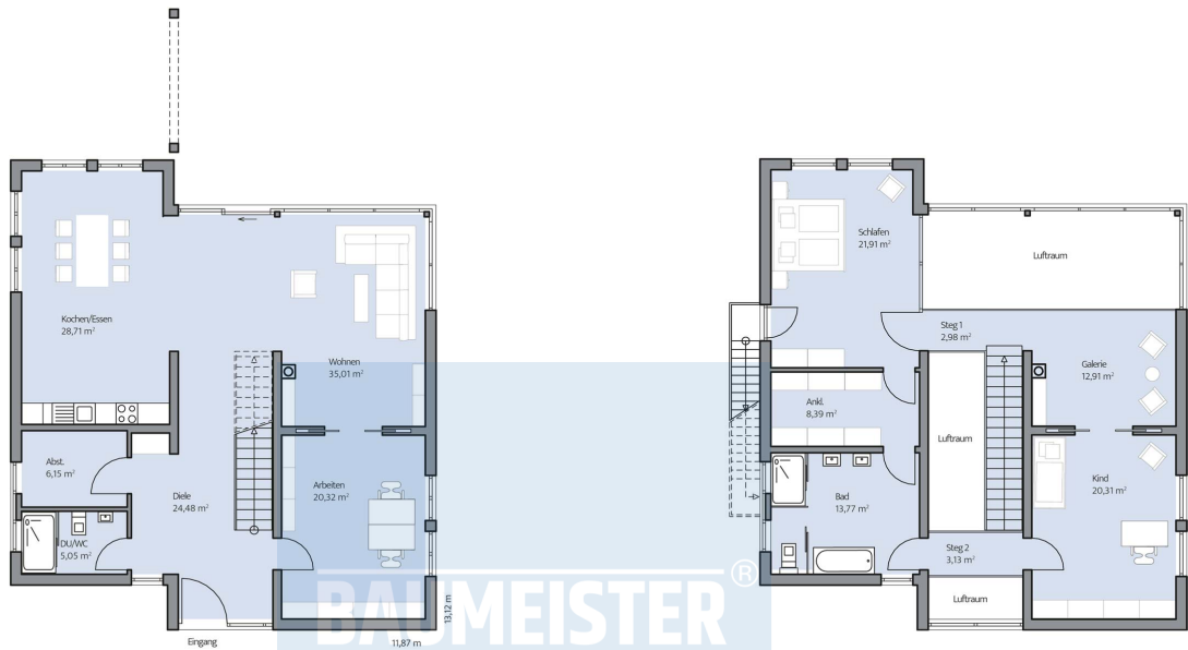
Haus Jonas Grundriss