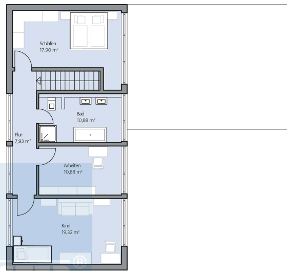
Haus Augstein Grundriss