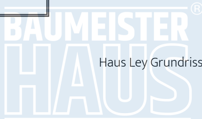
Haus Ley Grundriss